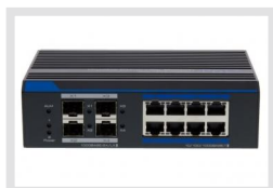
IAM-5SG1008MMA | Réf.: 216129