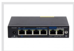
IAD-5SG1004MUA | Réf.: 216469