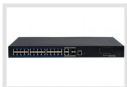
IAR-7SE1024MMA | Réf.: 214460