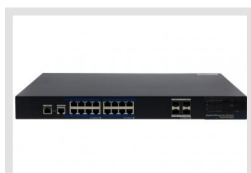
IAR-7SG1016MMA | Réf.: 216474