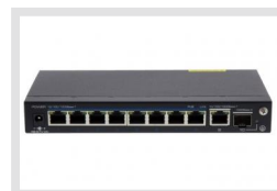
IAD-5SG1008MUA | Réf.: 216472