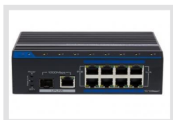
IAM-5SE1008MUA | Réf.: 214459