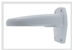
DOME-WB2-WI | Réf.: 216209