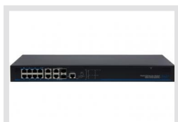
IAR-7SG1008MMA | Réf.: 216473