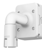
WM10-VB Kit de fixation murale