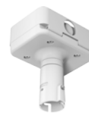
CM10-VB Kit de fixation au plafond