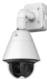
Avec kit de fixation murale